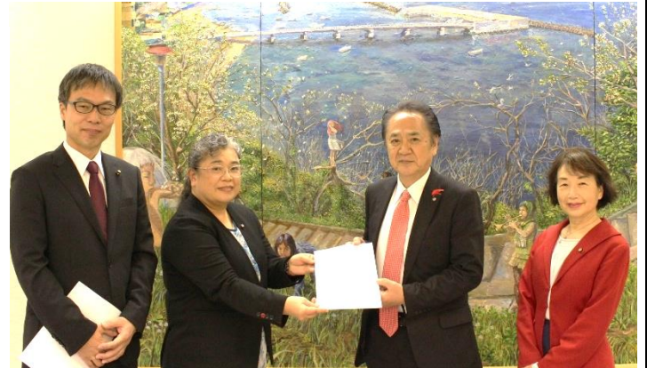
市長へ予算要望を提出する日本共産党議員団

今回の要望は全部で130項目。甚大な被害となった台風15号、19号を受けて、防災体制、避難所の整備を加えました。また、猛暑対策として、公共施設へのエアコン設置、国保や介護のこれ以上の値上げを避けるための努力を求めました。全文をご覧になりたい方はご一報ください。お届けいたします。(ブログにも掲載しました。)