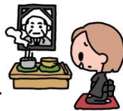
火葬場使用料(2015年4月1日～)