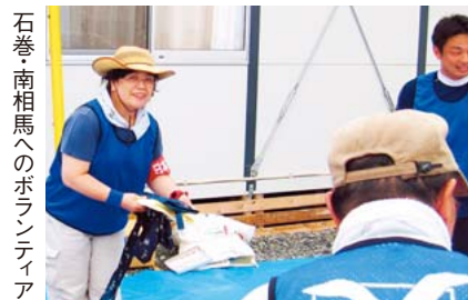
石巻南相馬へのボランティア